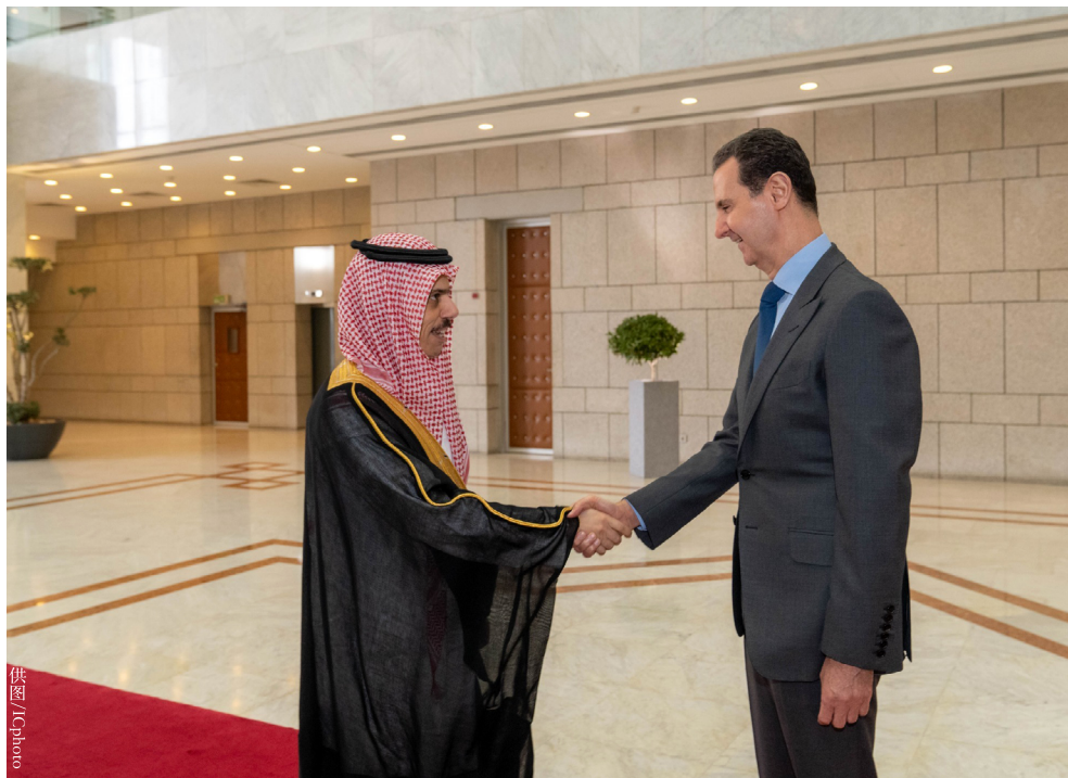
2023年4月18日，叙利亚总统巴沙尔·阿萨德会见到访的沙特外交大臣费萨尔·本·法尔汉。

亚政府终将掌控全局。叙内战爆发之初，叙领土不断被反对派武装和极端组织蚕食鲸吞。2015年俄罗斯强势介入后，叙政府逐渐收复失地，如今已控制叙境内近八成领土。今年3月，沙特外长在慕尼黑安全会议上表示，孤立叙利亚不起作用，应适时与叙政府对话。作为中东大国和阿拉伯世界的“领头羊”国家，沙特的这一公开表态表明地区国家已对叙政府终将长久掌权做出肯定判断。